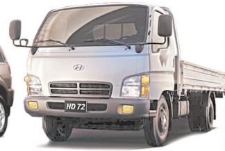
HYUNDAI КОММЕРЧЕСКИЙ ТРАНСПОРТ

ГАРАНТИЙНОЕ И ПОСЛЕГАРАНТИЙНОЕ ОБСЛУЖИВАНИЕ